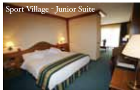
Sport Village - Junior Suite